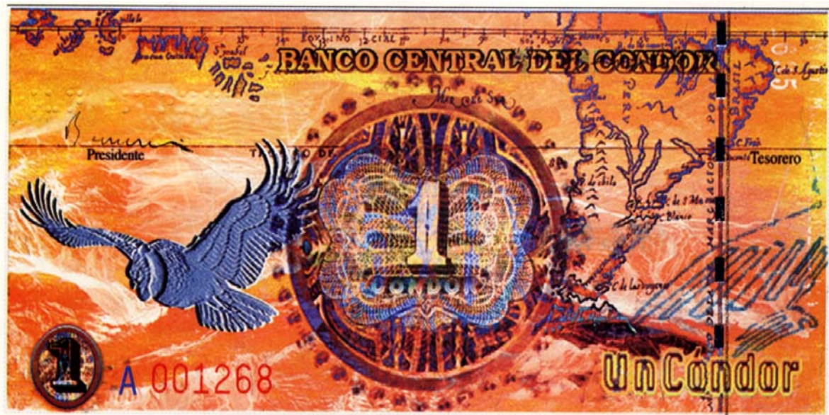
Banco Central del C3ndor, un c3ndor, serie A