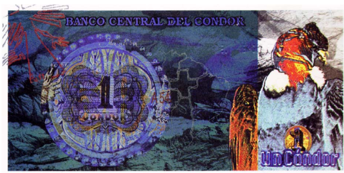
Banco Central del Cóndor, un cóndor, serie A

Asimismo, nos gustaría saber si alguien conoce las piezas emitidas y si quiere dárnoslas a conocer. Por nuestra parte, en un viaje que realizamos a Caracas, hallamos un ejemplar de un cóndor, el cual se lo damos a conocer.